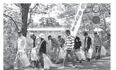
鳥屋野潟清掃の様子

特徴的な活動に「明日 Earth (平和運動・環境保全・社会福祉・被災地ボランティアほか)」がありますが、新潟県協では、新潟市中央区の実行委員会が主催する鳥屋野潟周辺の清掃活動に、毎年多数の組合員・家族から参加いただいています。