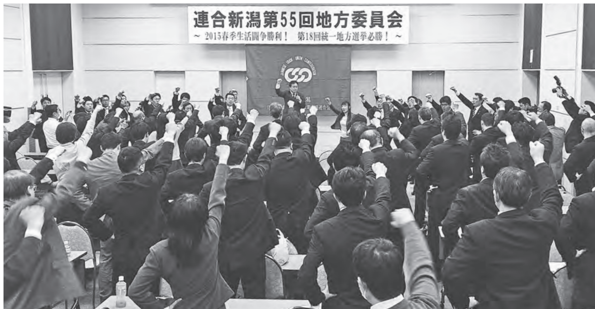
連合新潟第55回地方委員会 ～2015春季生活闘争勝利! 第18回統一地方選挙必勝!～

第288号 2015.2.15 日本労働組合総連合会 新潟県連合会 〒950-8558 新潟市中央区新光町6-2 TEL 025(281)7555 FAX 025(281)7556 発行人 齋藤敏明 題字 宮崎風穂 定価 1部5円 購読料は会費に含む