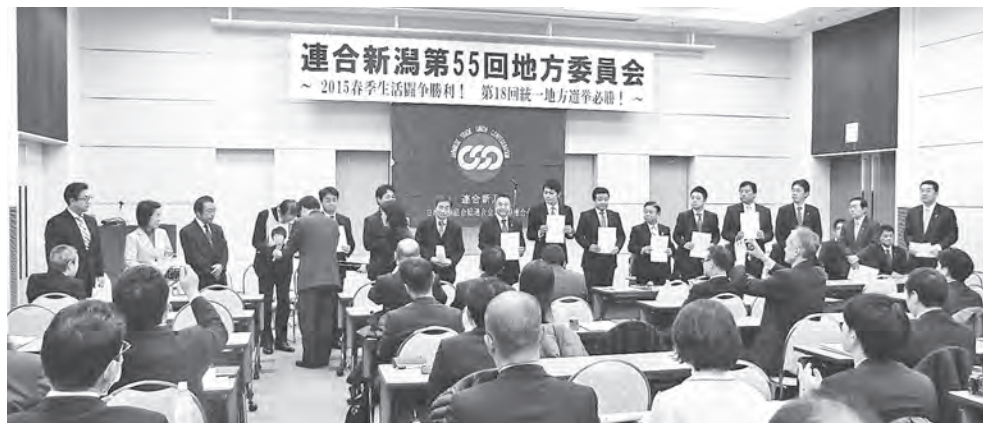
推薦決定書を手渡される候補者たち

また、一七時より新潟駅前において春季生活闘争開始宣言の街宣行動を行い、「賃上げ・底上げ・底支え・格差是正」に全力を挙げることがを、市民にアピールしました。