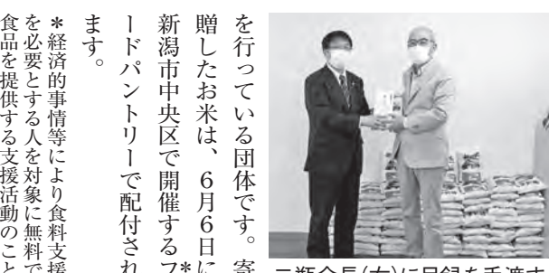
二瓶会長(右)に目録を手渡す

昨年活動が縮小したことをふまえ「にいがたお米プロジェクト」へ、コープクルコを通じてお米10万円分を寄贈することを確認し、4月26日に寄贈しました。「にいがたお米プロジェクト」は新潟市東区、中央区、西区の生活の厳しいひとり親家庭などに毎月無料でお米を宅配する取り組み