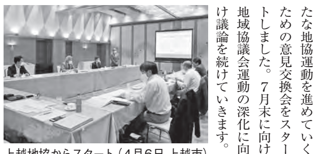
上越地協からスタート(4月6日上越市)

県内1カ所に集約することや、電話での労働相談であるフリーダイヤル(0120-1154-052)が、連合本部に集約されることになり、地域協議会が果たしてきた役割が大きく変わろうとしています。また、各地域協議会が担ってきた地区労協協の業務も、専従事務局長の配置が検討されています。これらを受け、連合新潟と各地域協議会では、取り巻く環境変化を認識し、新