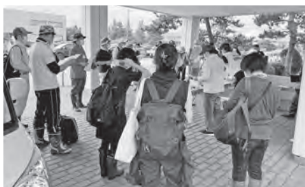
朝9時に集合後、各現場へ

に参加をさせていただきました。中越地震などでは被災者として助けられる場面が多く、いつかはこうしたボランティアに参加したと考えていました。また同じ参加者の方に、東日本で被災した方もおられ、少しでも力になればという思いを持っていらっしゃる方が多くいるのだと勇気をいただきました。作業自体は暑さや水を含んだ泥の為、過酷でしたが被災された方、ボランティア支援の方々と協力し何とか作業を終えることができました。