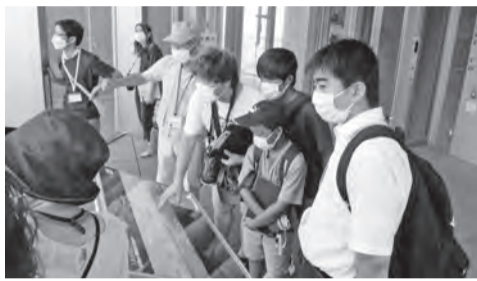
入船みなとタワーにて

機による銃爆撃や触雷により、連絡船「鉄工丸」、軍用船「宇治丸」、佐渡連絡船「おけさ丸」などの多数の船舶や工場民家などが大きな被害を受け、勤労員の生徒をはじめ、工具・乗客・船員など多くの尊い命が失われました。さらに新潟市出身の軍人軍属並びに市民の多くがひたすら祖国