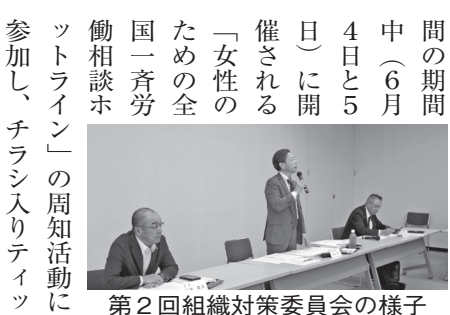
第2回組織対策委員会の様子

4月24日、第2回組織対策委員会を開催し、今後の取り組みなどについて議論しました。