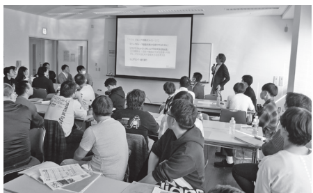
真剣に耳を傾ける参加者のみなさん

地協青年代表者会議では、連合新潟青年委員会と各地協青年女性委員会から2023年度活動報告、2024年度活動計画を全体へ共有し、意見交換を行いました。